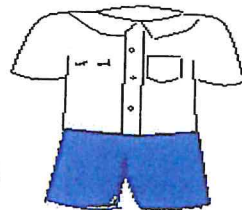
สีน้ำเงิน

๑๐. อุปกรณ์การเรียน ศูนย์พัฒนาเด็กเล็กจัดให้ตลอดปีการศึกษา