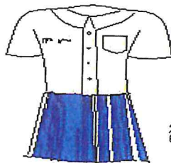
สีน้ำเงิน