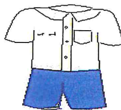
สีน้ำเงิน

๑๐. อุปกรณ์การเรียน ศูนย์พัฒนาเด็กเล็กจัดให้ตลอดปีการศึกษา