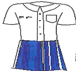
สีน้ำเงิน